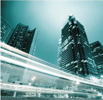
Fleet & Mobility Strategy

Identifichiamo il modello di approvvigionamento più efficace ed i migliori sistemi di gestione della flotta e della mobilità.