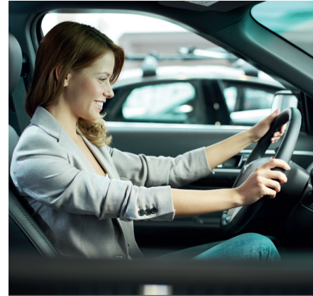
Employees & Drivers

Supportiamo la definizione delle policy sia nella scelta dei veicoli, sia per un migliore utilizzo di tutte le risorse.