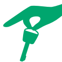
COMPANY CAR POLICY