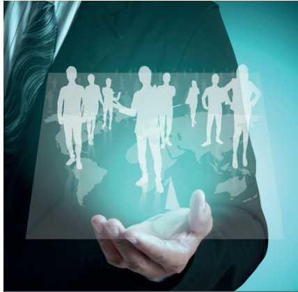
Policies & Organization

Identifichiamo il modello di approvvigionamento più efficace ed i migliori sistemi di gestione della flotta e della mobilità.